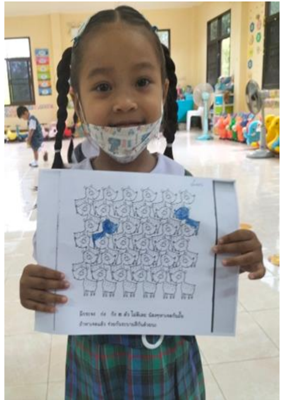
ใบงาน เรื่อง การรณรงค์ไม่สูบบุหรี่ของนักเรียนศูนย์พัฒนาเด็กเล็กองค์การบริหารส่วนตำบลคูริง