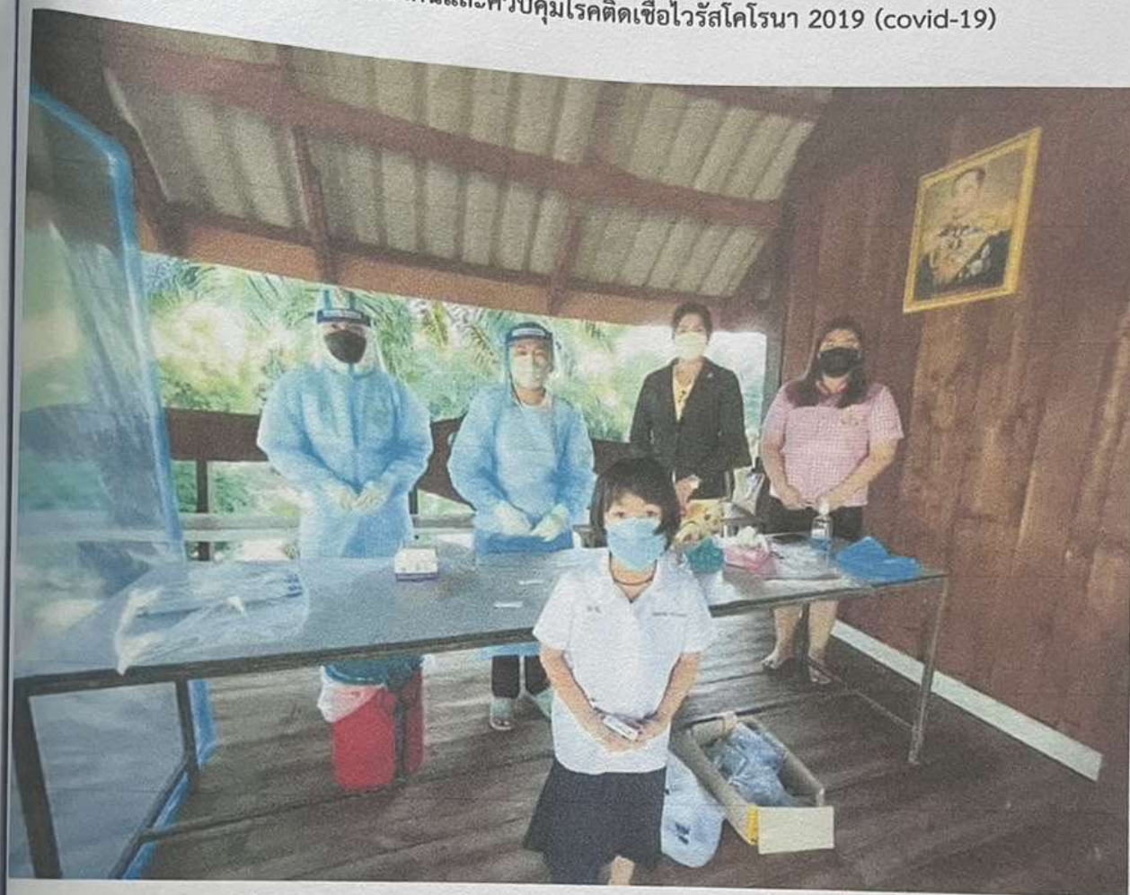
วัสดุอุปกรณ์เพื่อป้องกันและควบคุมโรคติดเชื้อไวรัสโคโรนา 2019 (covid-19)