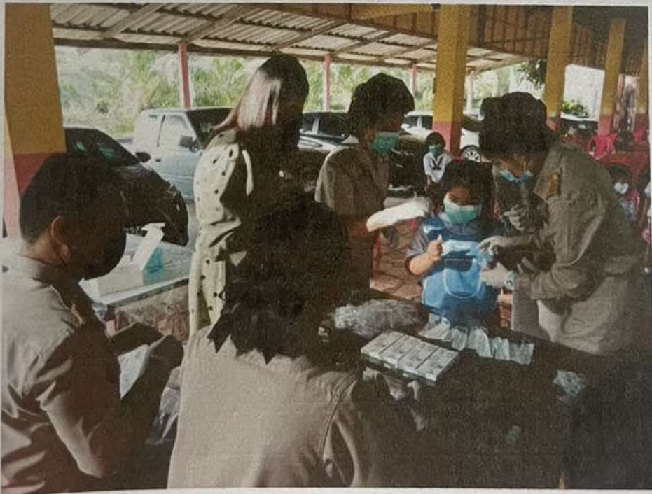
การตรวจคัดกรองหาเชื้อโควิด ๑๙ ด้วย Antigen test kit หรือ ATK