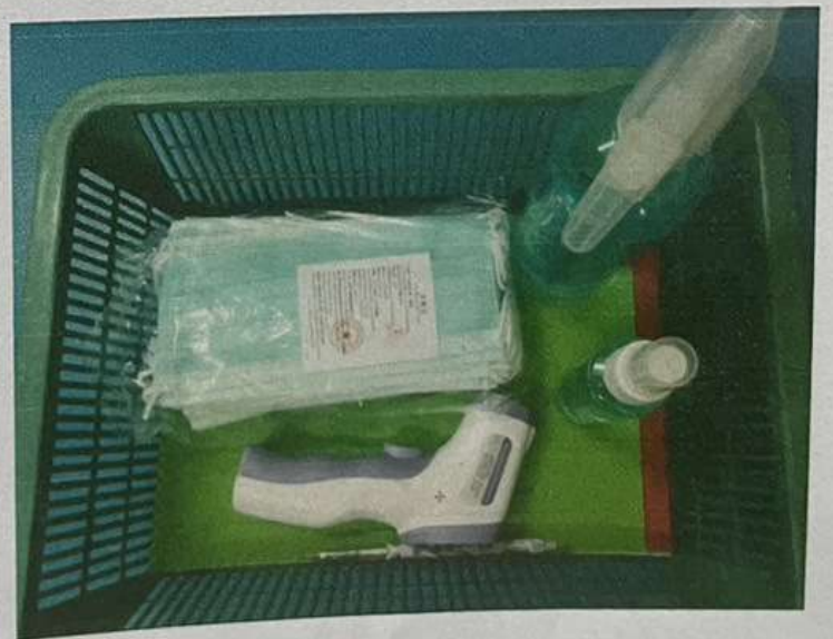
การตรวจคัดกรองหาเชื้อโควิด ๑๙ ด้วย Antigen test kit หรือ ATK