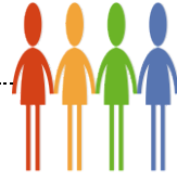
พนักงานส่วนท้องถิ่น