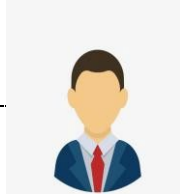
ผู้บริหารท้องถิ่น