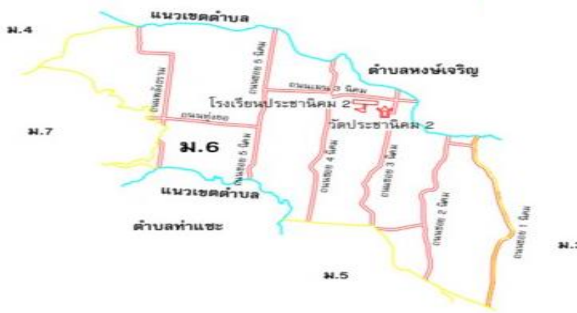
แผนที่ หมู่ที่ 6 บ้านทุ่งยอ