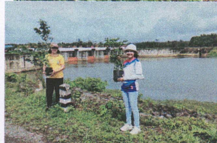
ทั้งนี้ อบต.คุริง ได้ประชาสัมพันธ์ผ่านช่องทาง Facebook “องค์การบริหารส่วนตำบลคุริง” ทุกกิจกรรม และได้ประชาสัมพันธ์ผ่านเว็บไซต์องค์การบริหารส่วนตำบลคุริงในบางโครงการด้วย